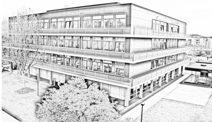
Verein der Freunde & Förderer des Köln-Kollegs e.V.